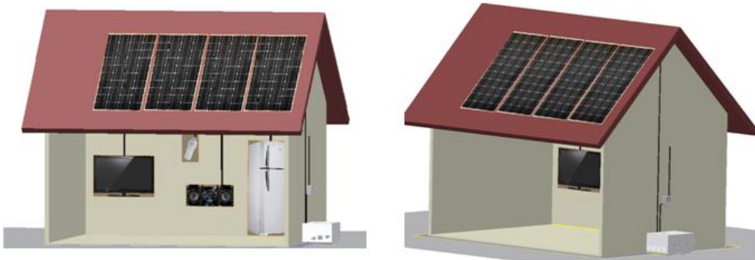
Figura 4: Padrão de montagem no topo da edificação

Quando a montagem do painel for no topo da edificação deve ser fixado paralelamente à superfície do telhado e não possuir ajuste de inclinação. Esta montagem é a mais adequada para locais de difícil acesso, desde que as edificações suportem esta instalação, conforme Figura 4. Esta alternativa somente pode ser implementada se previamente autorizada pela Enel Distribuição Ceará, e for tecnicamente viável.