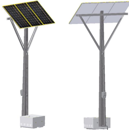
Figura 5: Padrão de montagem no poste

Linha de Negócio: Infraestrutura e Redes