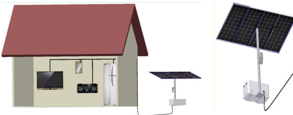
Figura 3: Padrão de montagem no solo

O armário deve ser instalado abaixo do painel fotovoltaico. Dentro do armário devem ser instalados o controlador de carga, bateria e inversor, devido às variáveis envolvidas, tais como espaço disponível, ventilação e gases provenientes das baterias, conforme Figura 3.