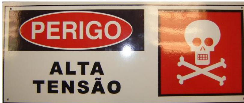
Figura 6: Placa de Advertência

A placa deve ser de policarbonato ter o formato retangular nas seguintes dimensões: 560x240x3mm, conforme Figura 6.